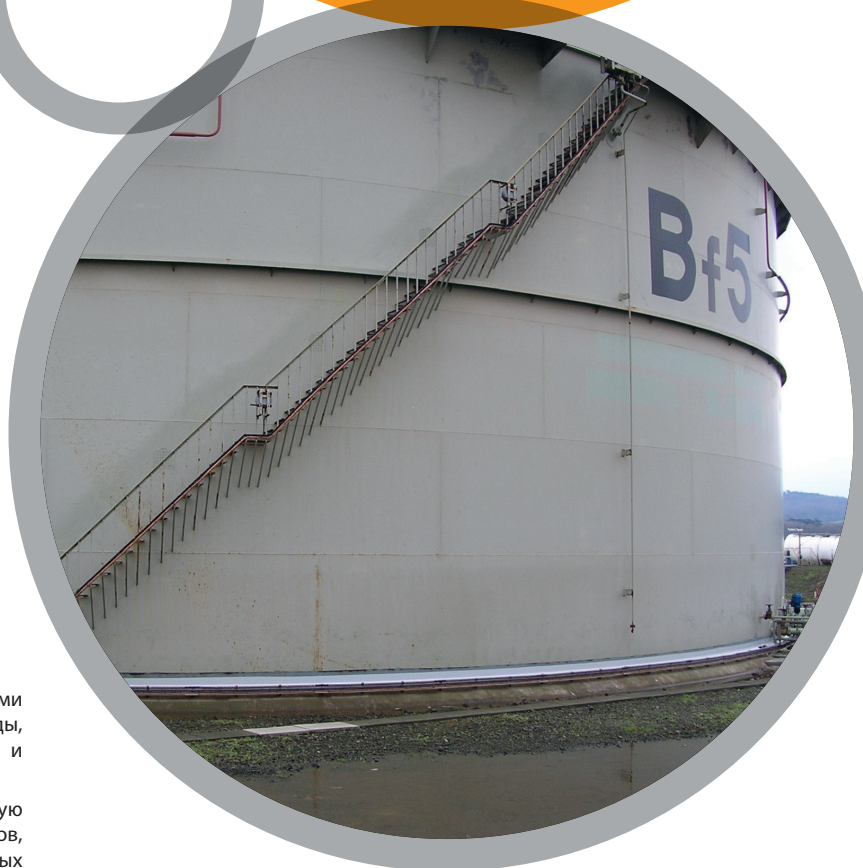
Резервуары-хранилища химических веществ

За дополнительной информацией обратитесь к: Belzona Технические характеристики продукта Belzona Инструкция по применению Belzona KNOW-HOW In Action