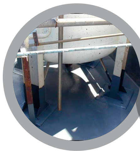
Обваловка химических хранилищ